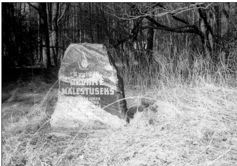
Letipea ohvrite mälestuskivi.

Apelli autoriteks on peetud Eesti geograafe ja ökolooge, kes olid mures Põhja-Ees-